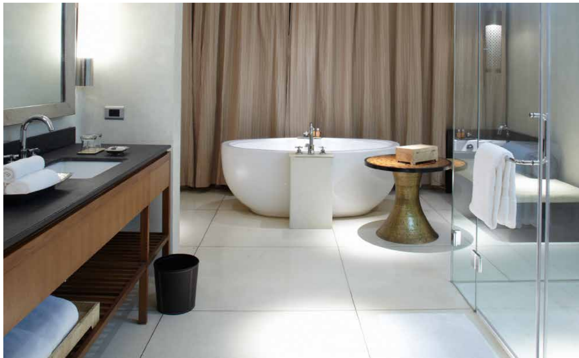
Die nachfolgenden Bilder sind Symbolbilder. Die Ausführung erfolgt in den jeweils angeführten Fabrikaten oder mit gleichwertigen Produkten.